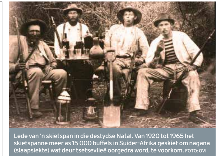
Lede van 'n skietspan in die destydse Natal. Van 1920 tot 1965 het skietspanne meer as 15 000 buffels in Suider-Afrika geskiet om nagana (slaapsiekte) wat deur tsetsevlug oorgedra word, te voorkom.