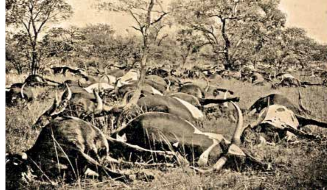
Hierdie beeste het in die vroeë 1900's op die grens tussen Suid-Afrika en Botswana weens runderpes gevrek. Die skatting is dat meer as 2,5 miljoen beeste gevrek het en vrylewende buffels uitgewis is.